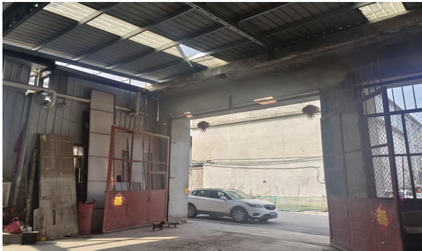
图 4 事故发生的钢结构厂房内部照片