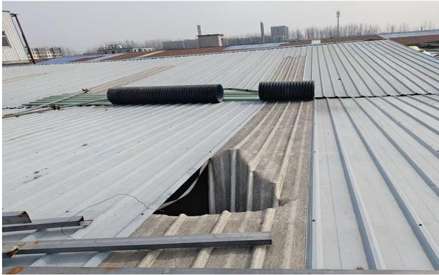
图 3 事故发生的钢结构厂房屋面照片