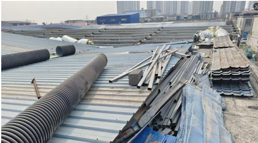
图 2 涉事厂房屋面情况图片